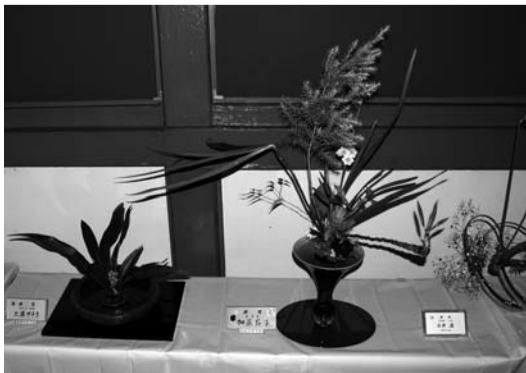
池坊奉納生け花展示