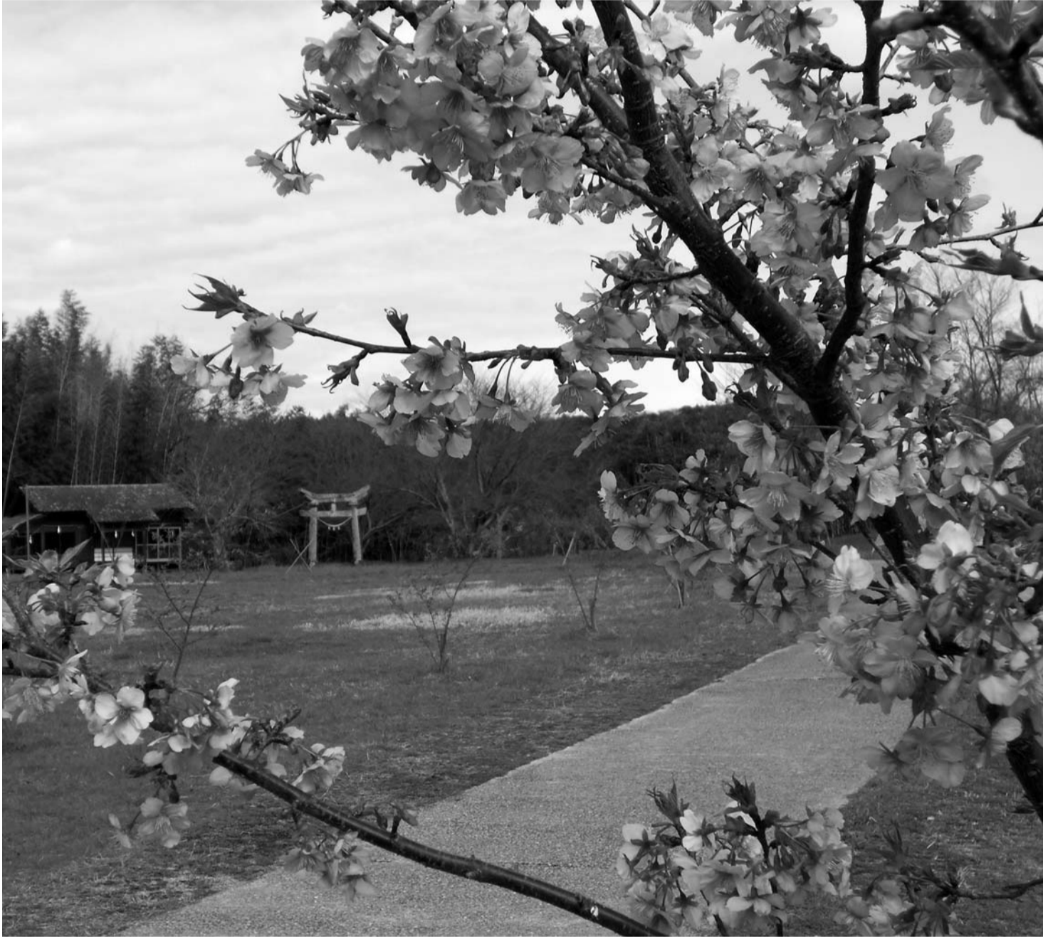
「御旅所(若宮広場)に咲く河津桜」

次回、通巻第九号は八月一日に折り込みます(内容…仲秋祭楽の市予告、新嘗祭に奉献のご依頼ほか)