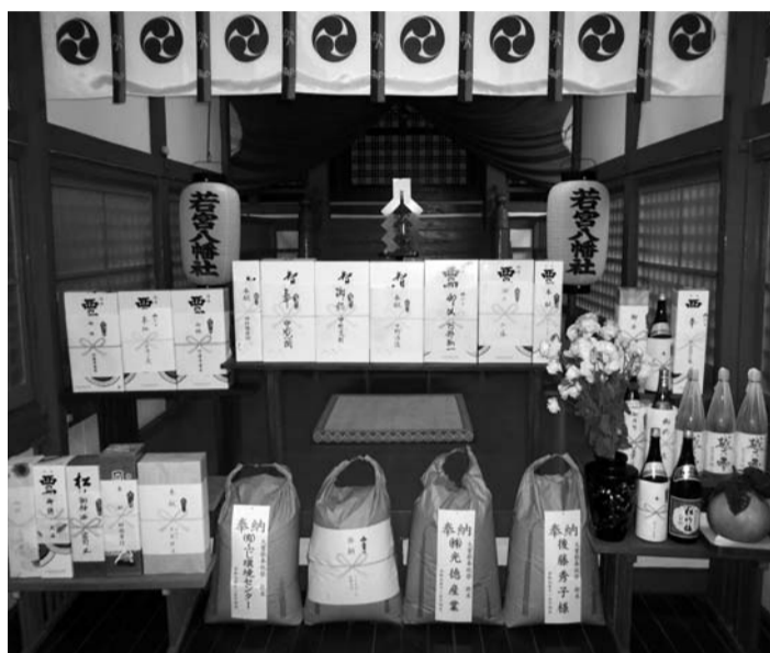
神前に供えられた奉献の品々